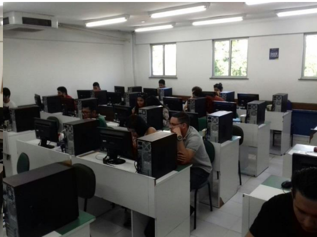
Figura 2: Laboratório B402