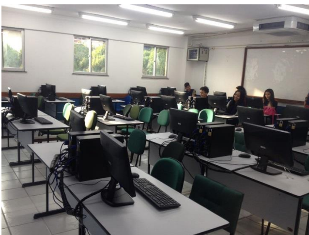
Figura 3: Laboratório B405