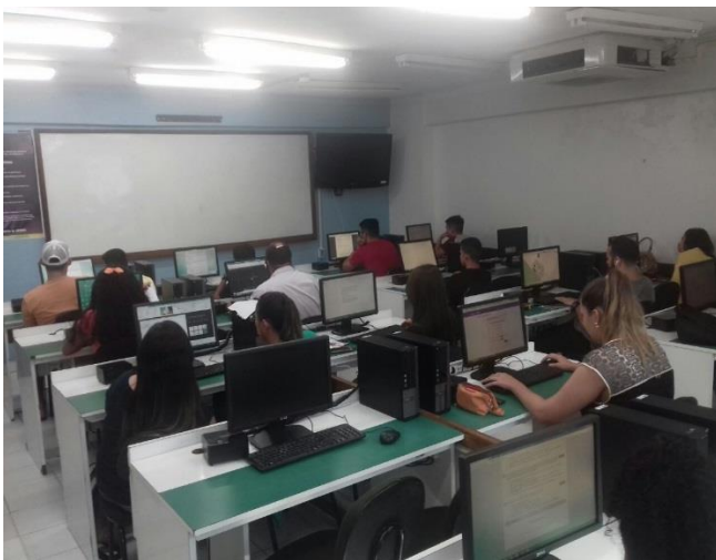
Figura 7: Laboratório 501