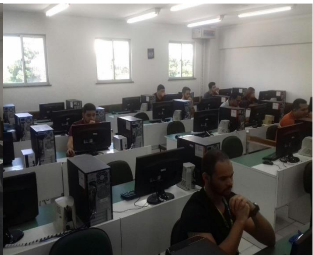
Figura 8: Laboratório 502