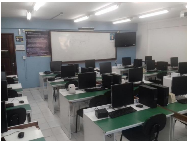
Figura 9: Laboratório 503