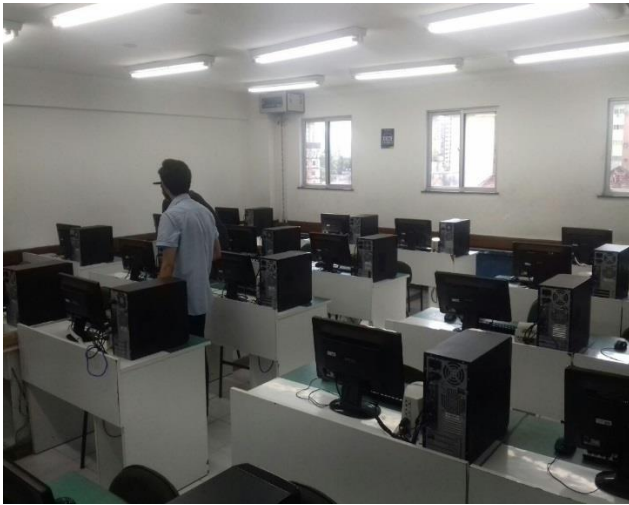
Figura 11: Laboratório 505