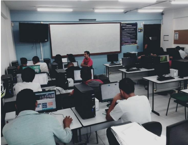
Figura 5: Laboratório B405