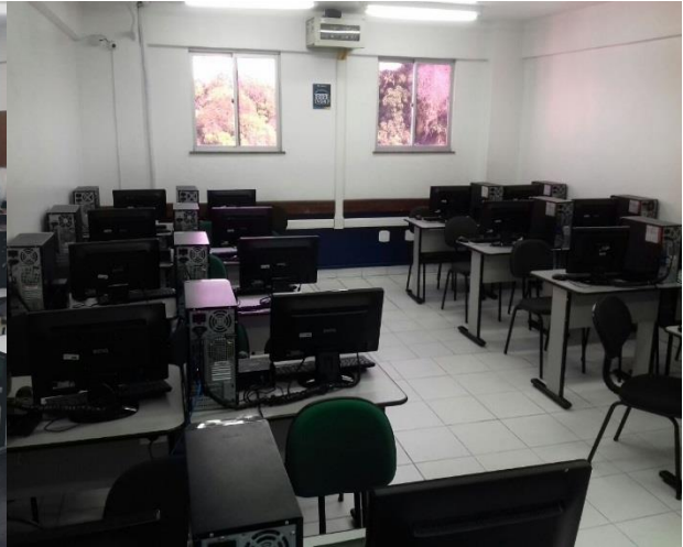
Figura 6: Laboratório 406